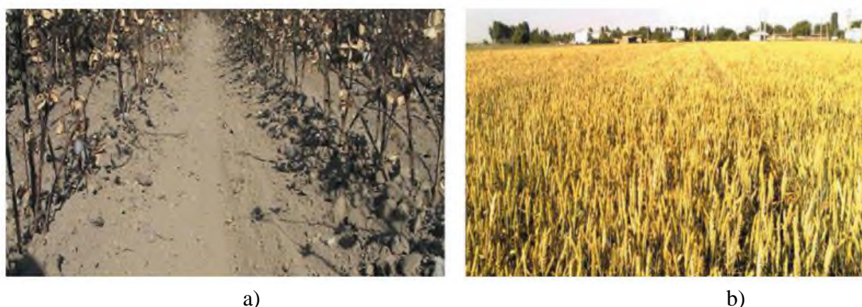
3-rasm. Tuproqqa ishlov berilgan va tekislangan g'ozapoyali dala va yetishtirilgan hosili: a- ishlov berilgan va tekislangan g'oz qator orasi; b- takomillashtirilgan texnologiya asosida yetishtirilgan kuzgi bug'doy hosili.

Takomillashtirilgan KXU-4 kultivatoriga o'rnatilgan tekislovchi panja va disksimon pichoqli qurol ishlash jarayonida g'oz poyasining pastki qismini tekislaydi va qator orasida don ekiladigan maydonni kengaytirdi (3-rasm). Bu, daladagi ko'chatlarning optimal qalinligini ta'minlash imkonini beradi va o'z navbatida hosildorlikni oshiradi [11].